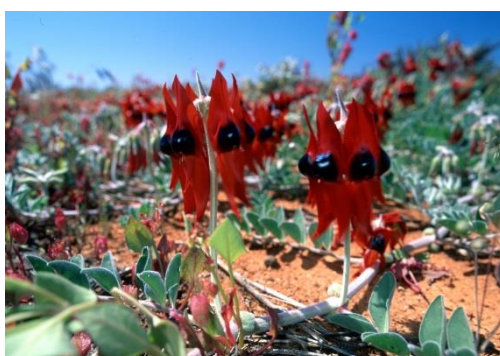
スタートデザートピー