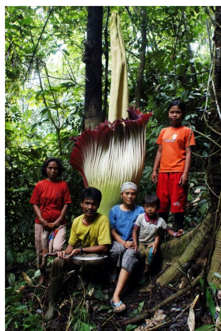
7年に一度しか咲かない ショクダイオオコンニャク