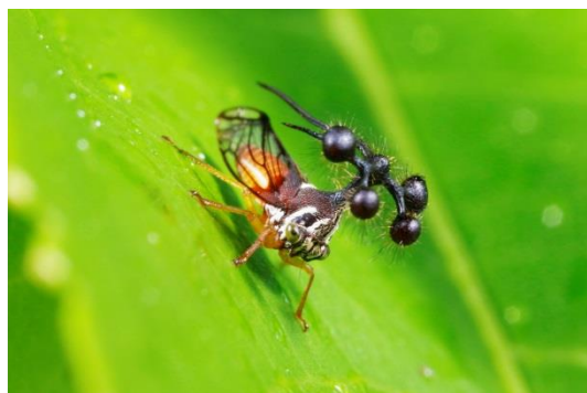
アンテナのような角を持つヨツコブツノゼミ