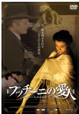
『プッチーニの愛人』