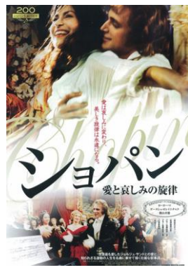
『シヨパン 愛と哀しみの旋律』