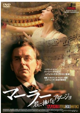
『マーラー 君に捧げる アダージョ』

世界で活躍した「音楽家」をモデルにした最近の名作映画を取り上げ、それぞれの人生の「どこが」クライマックスとして映像化されているかを考察します。