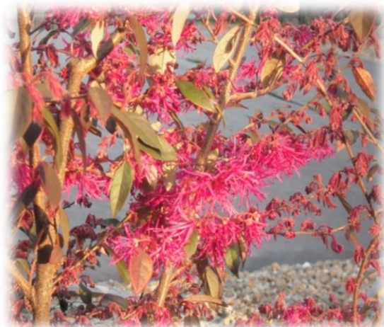
アカバナトキワマンサク

樹木医が庭木の悩み事を解決。手入れ次第で、 良くも悪くも変化する樹木に対して、 人が何処まで関わることができるのかどうか。 分かりやすく解説しますポイントを解説します。 10月から始まる6ヵ月講座です。