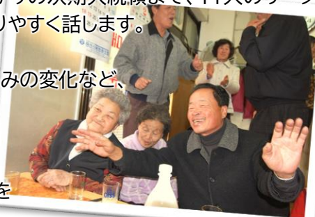
地方の食堂で飲み歌う人々

流行歌、労働歌、プロテスト・ソング、洋楽、日本歌謡など、韓国庶民が口ずさんできた歌を世相との関わりに力点を置いて話します。